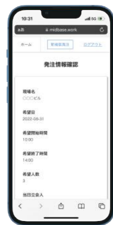
発注内容確認画面